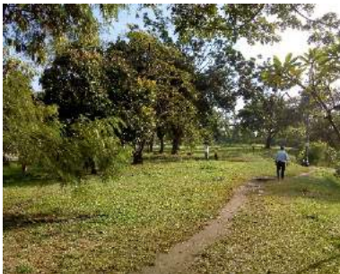
Figura 1. Área frente a la antigua fábrica de licores – margen izquierda.

Es la cuenca más reconocida en la cotidianidad de la ciudad. Se destacan sus valores ambientales y recreativos, aún conservados en la parte alta, con presencia de asentamientos ilegales sobre su franja protectora. En la parte baja, que comprende desde el jardín Botánico y el Zoológico hasta la calle 25, posee sectores con importante valor ornamental. Desde la calle 25 hasta su desembocadura en el río Cauca, el cual corresponde al tramo objeto del presente concurso, se invisibiliza a escala urbana, a pesar de que también goza de algunos espacios de calidad ambiental.