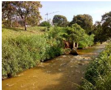
Figura 2. Río Cali antes de calle 34.