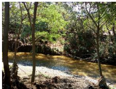
Figura 4. Río Cali – Antes de la desembocadura al río Cauca.