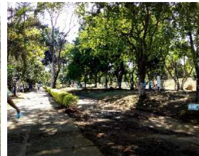
Figura 3. Área forestal – Brisas de los Álamos.