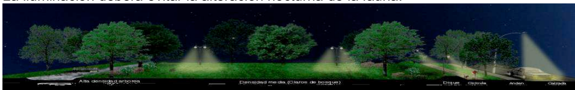
Figura 5. Perfil Nocturno indicativo para evitar afectación a la fauna.

La iluminación deberá evitar la alteración nocturna de la fauna.