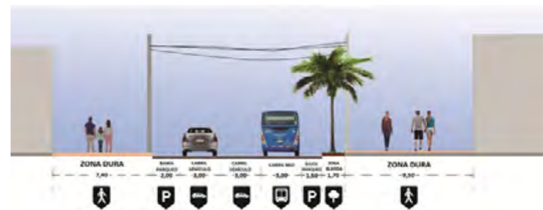
Figura 3: Perfil vial de la Avenida Sexta Norte entre Calles 12AN y 13N.