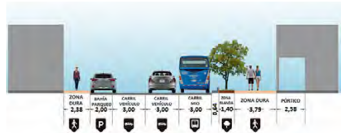
Figura 1: Perfil vial de la Avenida Sexta Norte entre Calles 12N y 12AN.